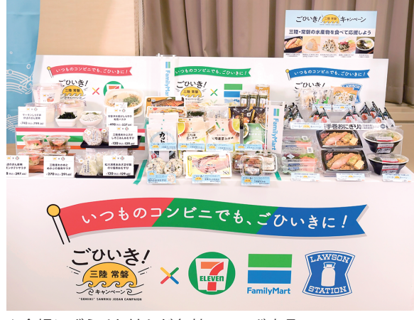
会場にずらりと並んだ各社のコラボ商品

おいしさ、魅力を様々な場所やSNSで話すたびに、多くの方から「もっと身近な場所で食べたい!私たちも協力したい!」という声をたくさんいただきました。コンビニ大手3社の協力でみなさんの身近に三陸常磐ものがくるので、存分に味わってほしいです」と語りました。